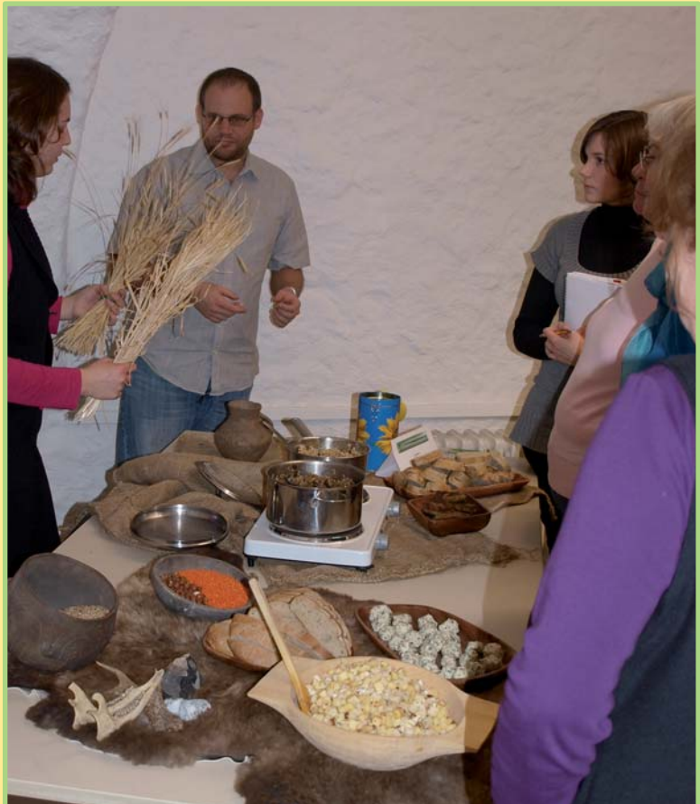
Beim perfekten Dinner.

Am Freitag, den 19.11.2010, fand der zunächst verschobene Vortragsabend „Das Perfekte Dinner - Ernährung von der Steinzeit bis zur Römerzeit“ in veränderter Form unter dem Titel „Ernährung in der Vorgeschichte“ im Gewölbekeller des Instituts für Vor- und Frühgeschichte statt. Für die Nutzung des Saales sei an dieser Stelle Herrn Prof. Oldenstein und dem Institut herzlich gedankt. Die kleine, aber äußerst interessierte Gruppe von fünf Gästen, zwei Vorständen und einer dpa-Reporterin konnte bei einem Glas kühler Apfelmilch einen ersten Eindruck von den Nahrungsmitteln der Vorgeschichte sammeln und sich auf den folgenden Vortrag einstimmen. Vor dem Hintergrund eines reichhaltigen Buffets aus jungsteinzeitlichen und eisenzeitlichen Speisen begann darauf der Vortrag. Nach einer kurzen Einführung in den Begriff der